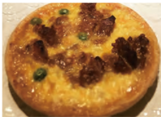
近藤亭 Quicheya(きっしゅや)